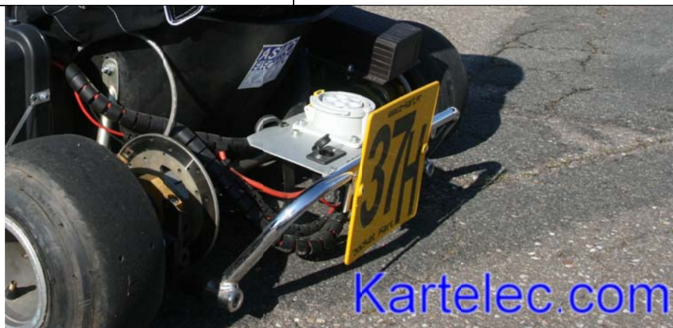
Sur le panneau à l'arrière du kart