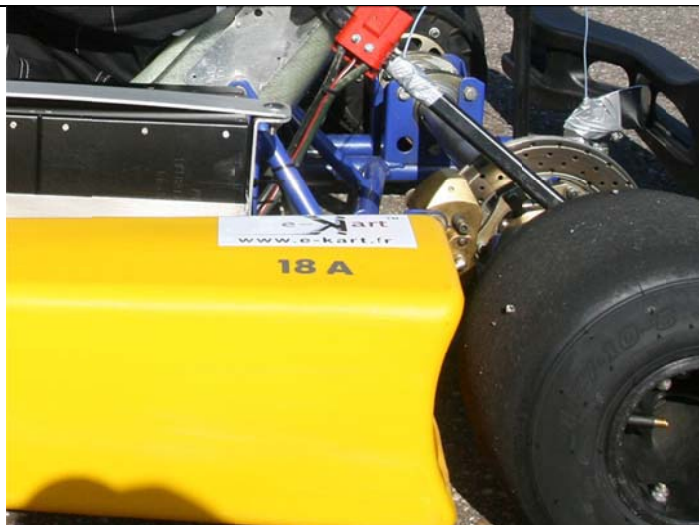
Sur les pontons